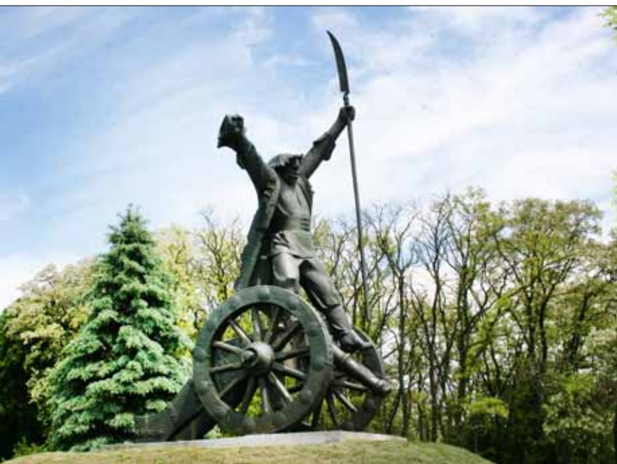
Pomnik Bartosza Głowackiego w Janowiczkach k/Racławic