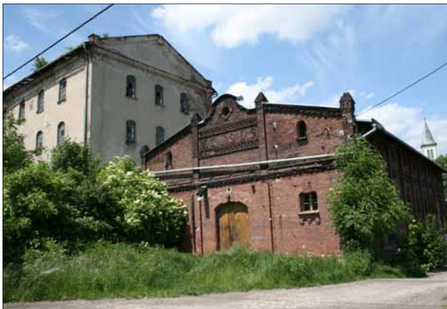
Zakłady Przemysłowe A. Malatyński w Charsznicy (stan obecny)