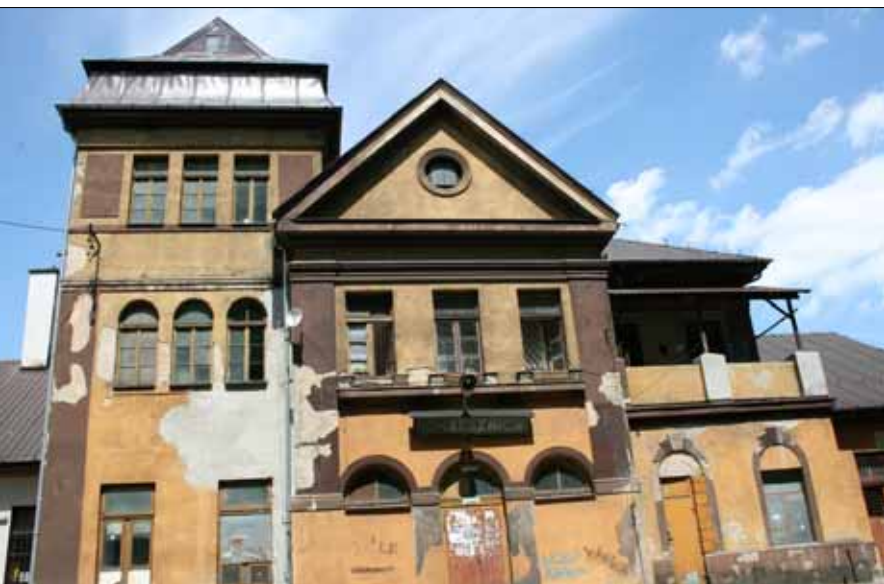
Stacja kolejowa w Miechowie-Charsznicy (XIX w.)