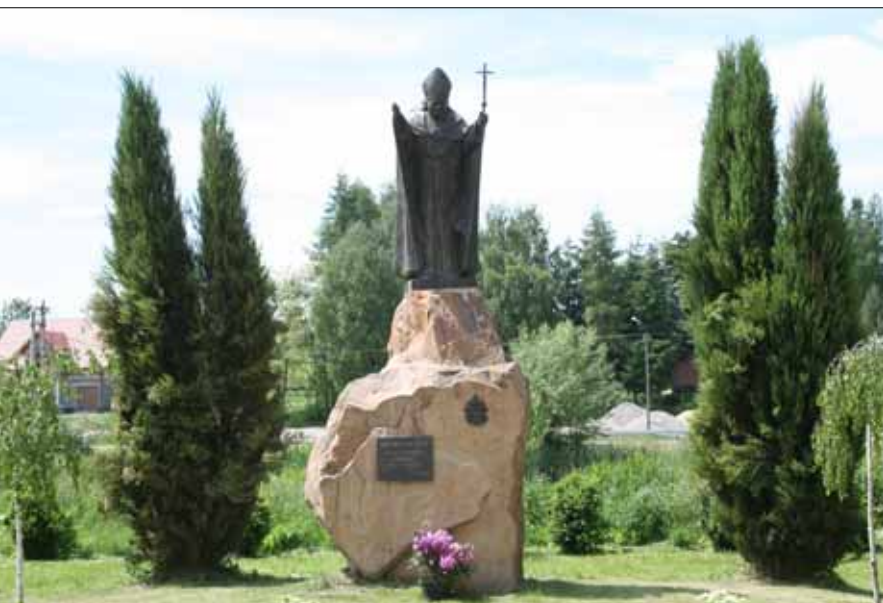
Pomnik św. Jana Pawła II w Racławicach