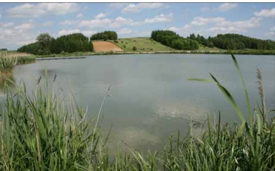
Staw w Tczycy, gm. Charsznica