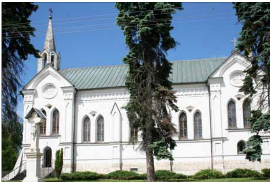
Kościół św. Mikołaja w Staboszowie