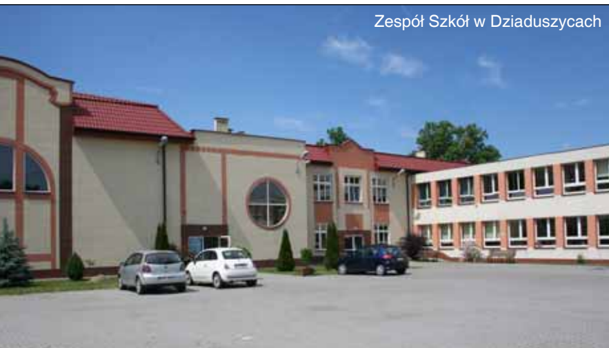
Zespół Szkół w Dziaduszycach

Ożywieniem dla terenu obecnej gminy było przeprowadzenie przez Austriaków w 1916 r. linii kolejki wąskotorowej łączącej wieś z Miechowem, Działoszycami i Kazimierzą Wielką, która w istotny sposób wpłynęła na zwiększenie handlu i dystrybucję produktami rolnymi w tym rejonie, zwłaszcza burakami cukrowymi dla cukrowni „Łubnia”. Ten środek transportu działał jeszcze z powodzeniem kilka lat po II wojnie światowej rekompensując brak w tej gminie podstawowej sieci dróg. Sytuacja uległa radykalnej zmianie z końcem lat 60. ubiegłego wieku (rozbudowa dróg i kasacja kolejki).