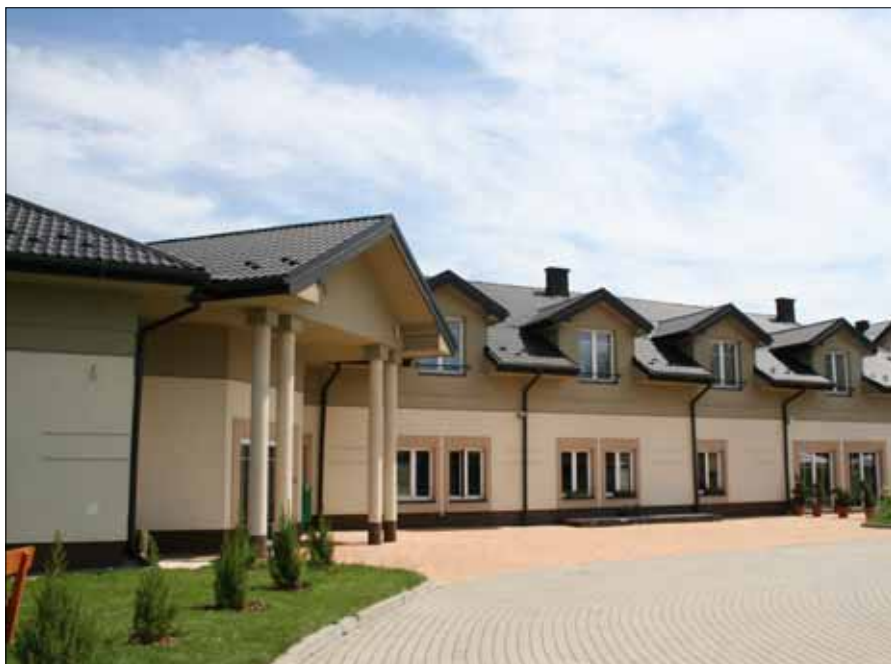
Hotel Mercure Raclawice Dostłorice Conference & SPA