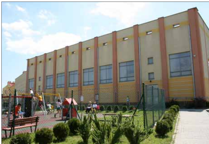
Hala sportowa w Gołczy