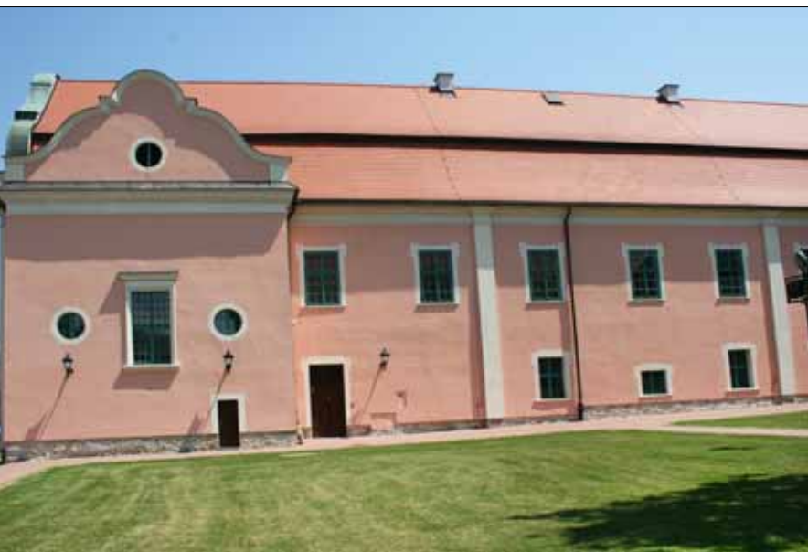
Muzeum Ziemi Miechowskiej