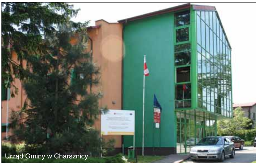
Urząd Gminy w Charsznicy