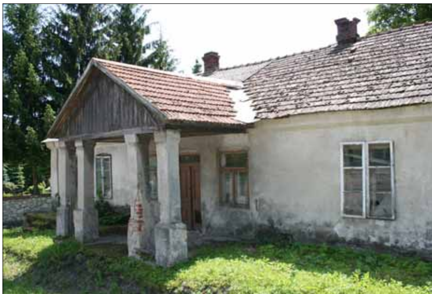
Stara karczma w centrum Wysocic, gm. Gołcza