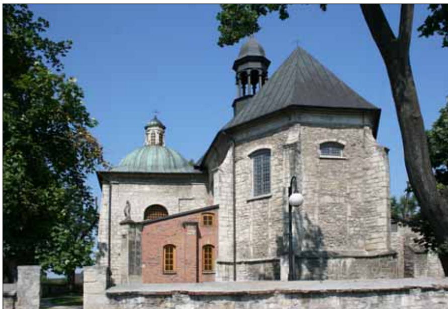
Kościół św. Wojciecha w Książu Wielkim