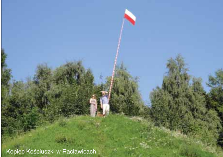
Kopiec Kościuszki w Raclawicach

dwór w Janowiczkach i sędziwa lipa (ok. 300 lat), pod którą podobno odpoczywał naczelnik insurekcji. Raclawice jako miejsce historycznej bitwy uznany został za Pomnik Historii na mocy rozporządzenia prezydenta RP z 2004 r. Także w Janowiczkach znajduje się willa premiera II Rzeczypospolitej płk. Walerego Sławka, którą otrzymał w darze od społeczeństwa polskiego. Co roku gminę popularyzują plenierowe imprezy organizowane na błoniach przed pomnikiem dzielnego Bartosza: Wybory Chłopa Roku połączone ze zlotem Bartoszków i Wojciechów, Zlot Kawalerów Krzyża Wojennego Virtuti Militari i rekonstrukcja pamiętnej batalii z 1794 r.