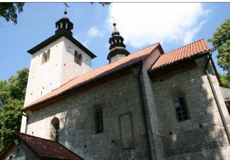
Kościół św. Mikołaja w Wysocicach, gm. Gołcza