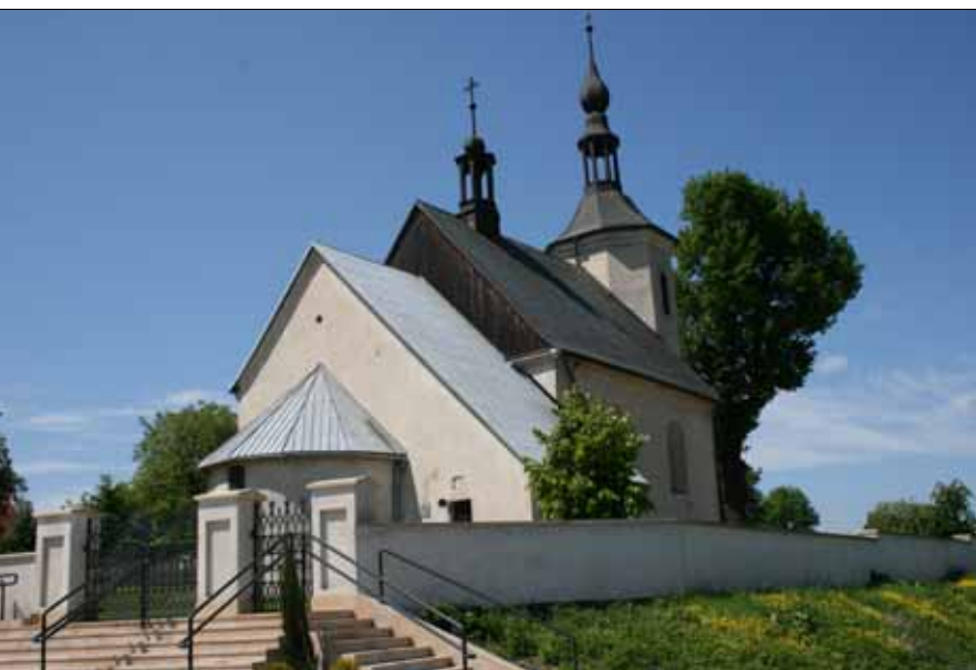
Kościół św. Bartłomieja w Czaplach Wielkich, gm. Gołcza