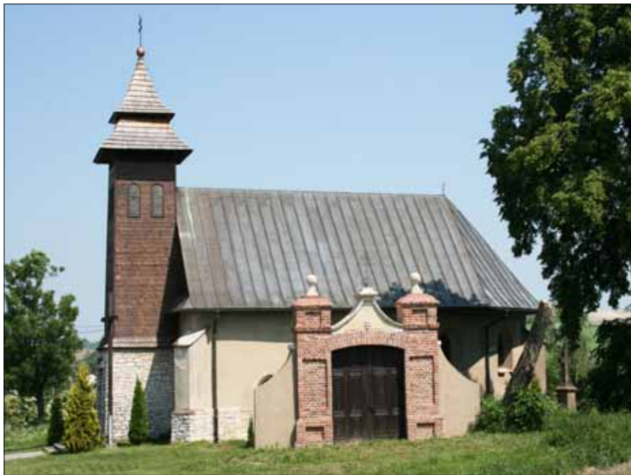
Kościół Świętego Krzyża w Siedliskach k/Miechowa