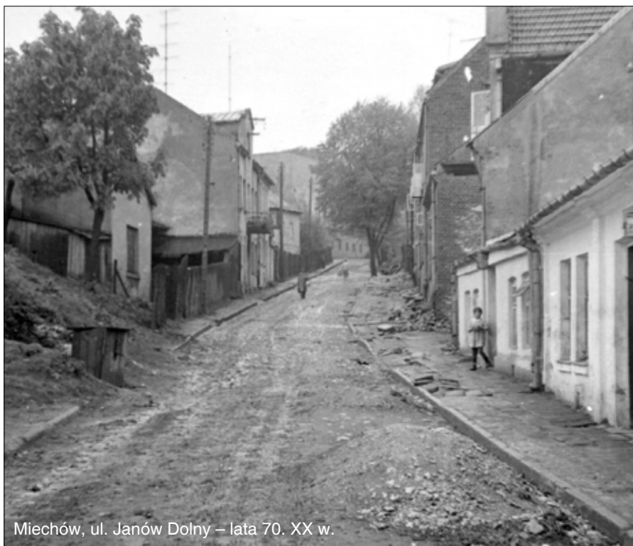
Miechów, ul. Janów Dolny – lata 70. XX w.

1975 – zmiana podziału administracyjnego państwa z trójstopniowego na dwustopniowy. W miejsce poprzedniej liczby województw i powiatów powstało 49 województw (ówczesnym reformatorom chodziło o zmniejszenie liczby stopni decyzyjnych, wykreowanie ośrodków ponadlokalnych i skuteczniejsze zarządzanie aglomeracjami).