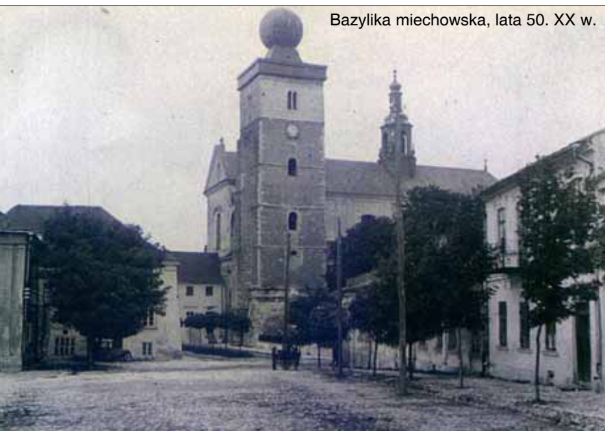
Bazylika miechowska, lata 50. XX w.

1950 – formalnie zlikwidowano samorząd terytorialny, umniejszając jego rangę, a tworząc terenowe organy jednolitej władzy państwowej. Były wtedy 22 województwa, 271 powiatów i 53 miasta wydzielone, stanowiące samodzielne powiaty.