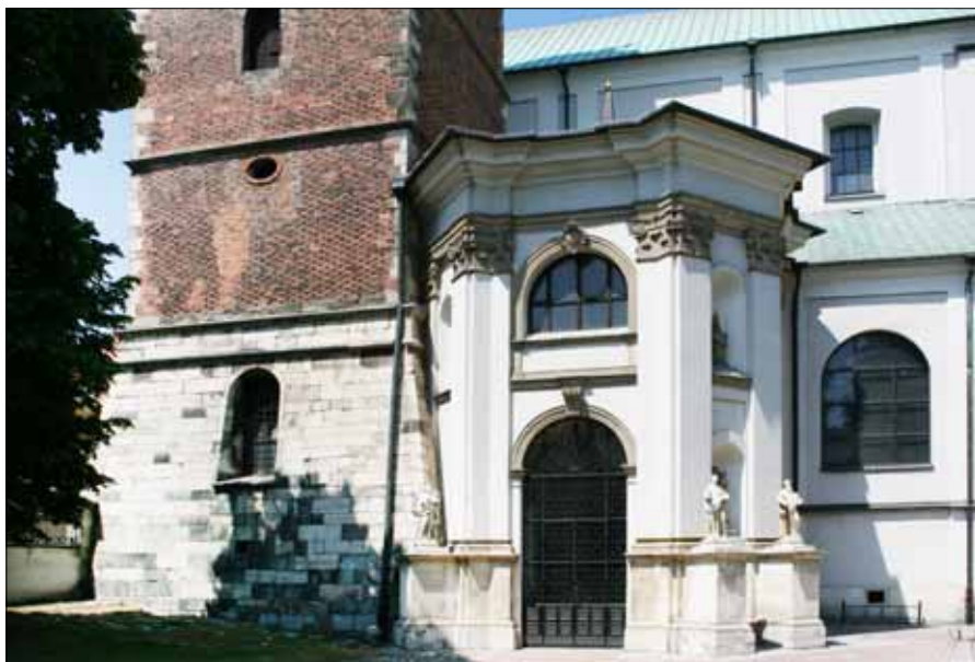
Kruchta bazyliki Grobu Bożego w Miechowie