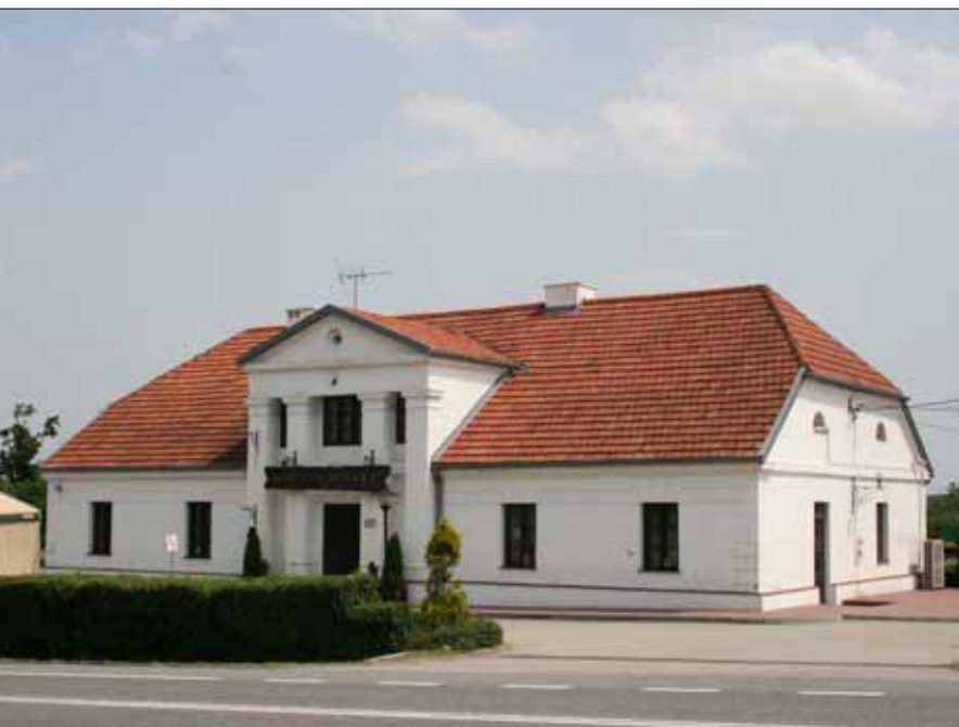
Karczma w Antolce, gm. Książ Wielki