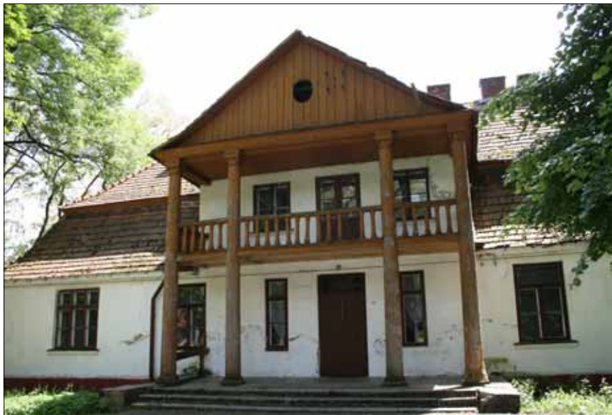
Drewniany dwór w Janowiczkach k/Raławic