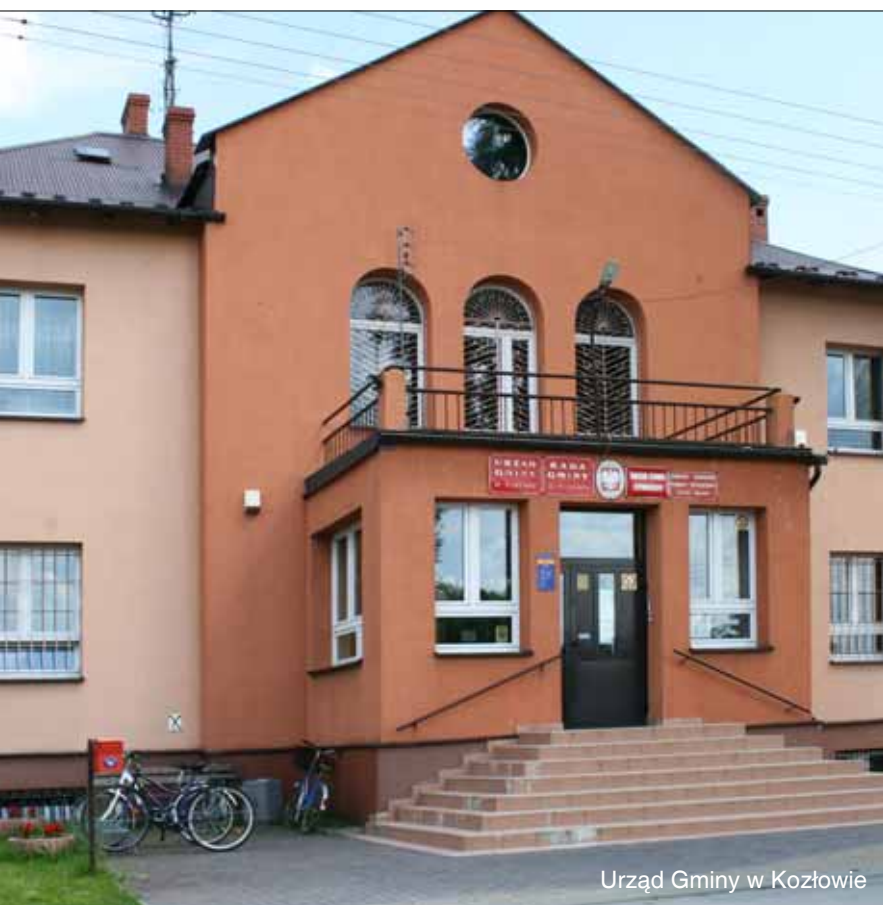
Urząd Gminy w Kozłowie

Najdalej na północ wysunięta gmina powiatu zlokalizowana pomiędzy ciekami wodnymi Mierzawy, Uniejówki i Nidzicy. Teren topograficznie zróżnicowany, z dominacją szerokich i płaskich garbów. Najwyższym punktem gminy jest Biała Góra (415,5 m n.p.m.). Pod nią znajduje się najdłuższy w Polsce dwuwłotowy tunel kolejowy o długości 810 m, który powstał w latach 1882–85 i jego druga odnoga przebita do 1912 r. (obecnie przy stacji Tunel). Gmina jest miejscem ważnego węzła komunikacyjnego, z którego rozchodzą się linie kolejowe w kierunku stolicy, Krakowa i Częstochowy. Na terenie kozłowskim dominują