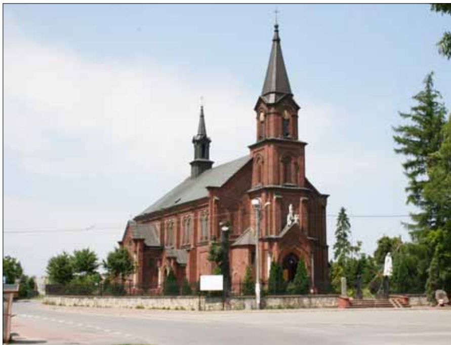
Kościół pw. Podwyższenia Krzyża Świętego w Kozłowie