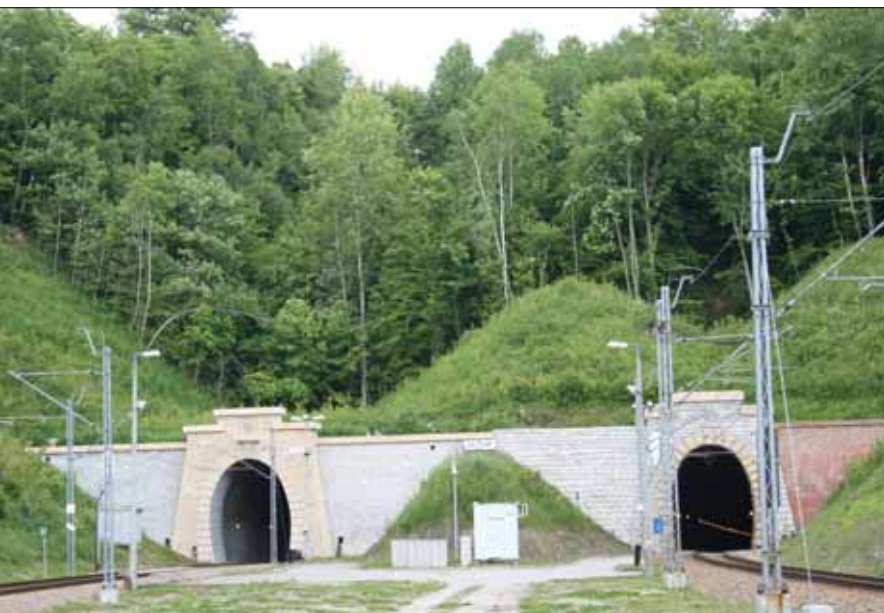
Podwójny tunel kolejowy pod Białą Górą, gm. Charsznica