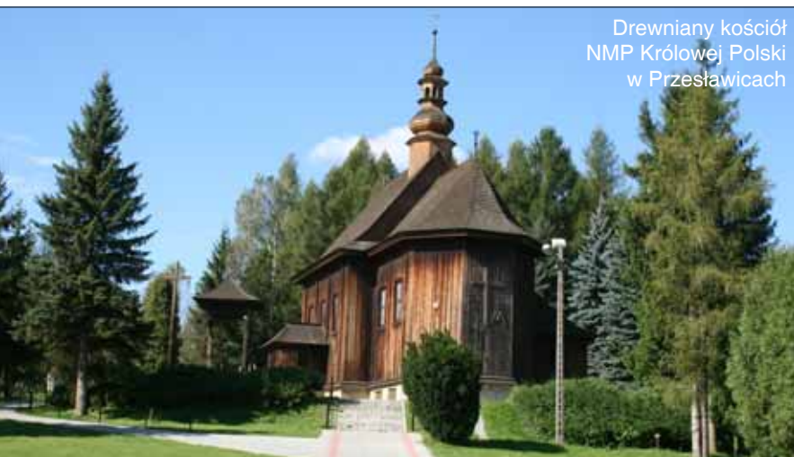
Drewniany kościół NMP Królowej Polski w Przesławicach

Miechów ma bardzo bogatą przeszłość. Jego początki sięgają roku 1163, kiedy możnowładca Jaksa z rodu Gry-