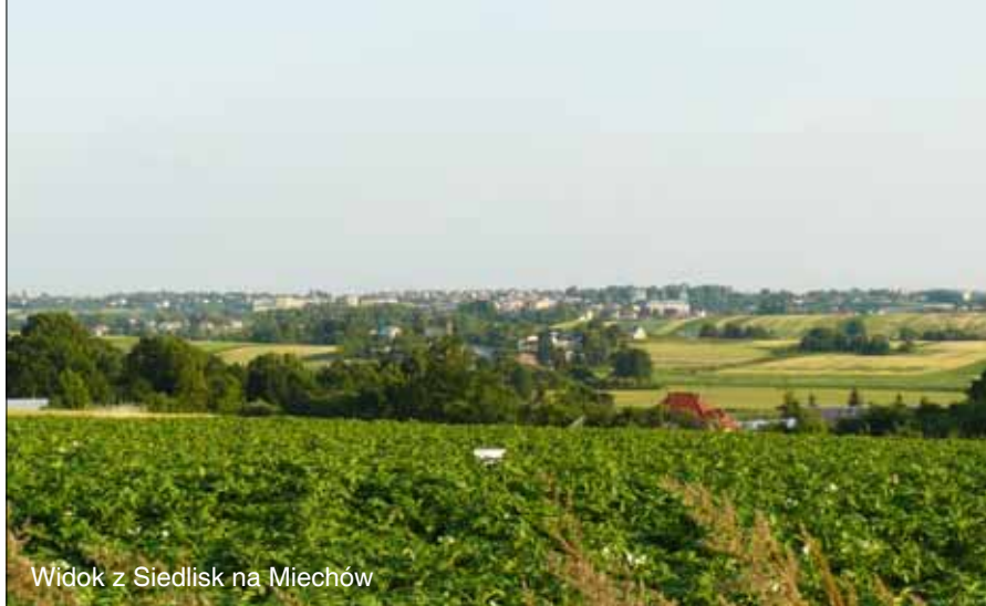
Widok z Siedlisk na Miechów

Charsznica z upraw różnych gatunków kapusty (tzw. kapuściana stolica Polski), gmina Słaboszów z produkcji mleka i upraw buraków cukrowych, gmina Książ Wielki – z hodowli trzody chlewnej i przetwórstwa mięsa.