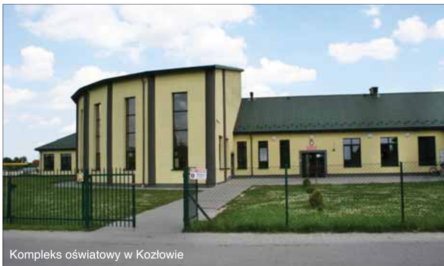
Kompleks oświatowy w Kozłowie

pola uprawne (70% pow. gminy). O Kozłowie pisano już w 1257 r. (dokumenty klasztoru s. Klarysek w Zawichoście). Historia miejscowości sięga panowania Bolesława V Wstydliwego. Na terenie gminy znajdują się rezerваты przyrody z cenną roślinnością i drzewostanem – Biała Góra i Kępie. Najważniejszy zabytek sakralny – kościół pw. Podwyższenia Krzyża Świętego w Kozłowie (na bazie wcześniejszych drewnianych). Powojennym symbolem gminy był jeden z najnowocześniejszych zakładów zbożowych w Polsce z elewatorami o poj. 35,5 tys. ton, który powstał w ramach planu 6-letniego (obecnie zrujnowany).