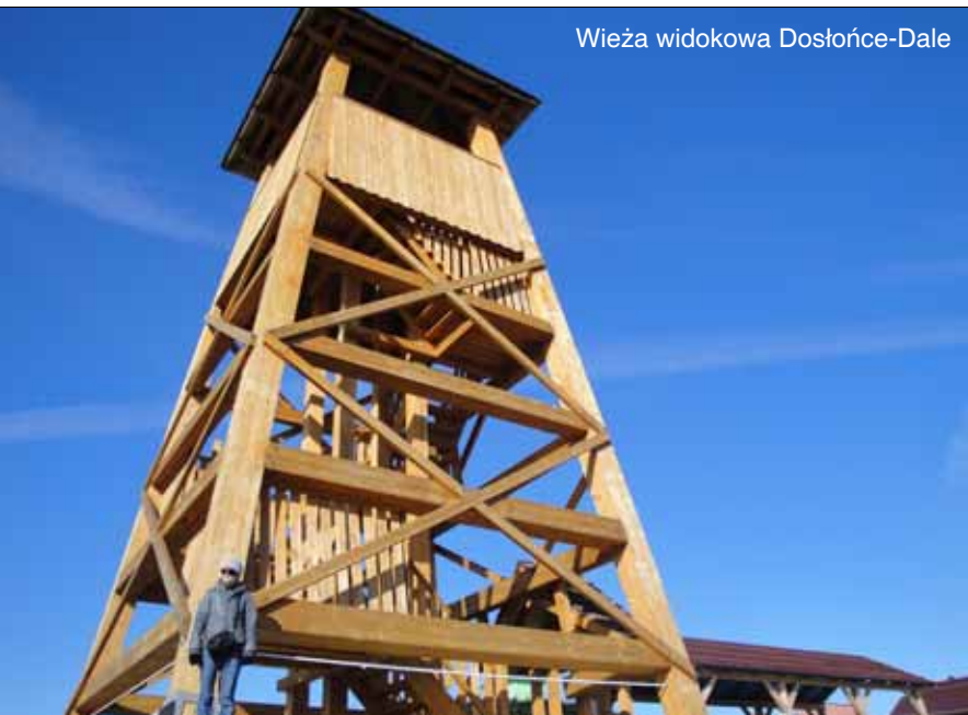
Wieża widokowa Dostońce-Dale

Mamy nadzieję, że niniejsza publikacja ułatwi Czytelnikom wędrówki po powiecie miechowskim, gdzie na każdym kroku historia styka się ze współczesnością.