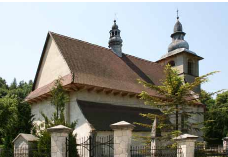
Kościół św. Wojciecha w Sławicach, gm. Miechów