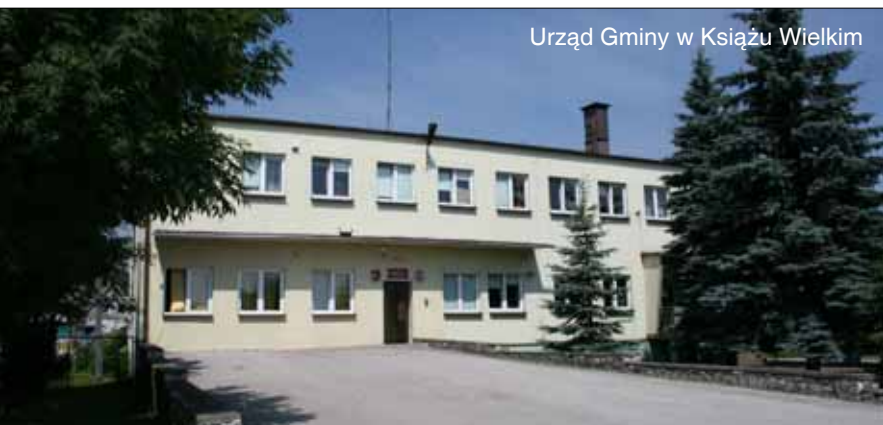
Urząd Gminy w Książu Wielkim

Książ Wielki ma bardzo bogatą historię. Uznawany jest za jedno ze starszych osiedli prastowiańskich w Małopolsce. Najstarszy zapis pochodzi z 1120 r. Od 1385 r. miał prawa miejskie (za panowania królowej Jadwigi) i jako jedyna w powiecie miejscowość poza Miechowem miał swój herb miejski. Ostatecznie w r. 1885 za udział mieszkańców w powstaniu styczniowym decyzją zaborcy rosyjskiego utracił status miasta. Był też Książ Wielki w latach 1400–1795 siedzibą rozległego Powiatu Książskiego sięgającego od południa niemal Wisły, zaś na północy do Nidy.