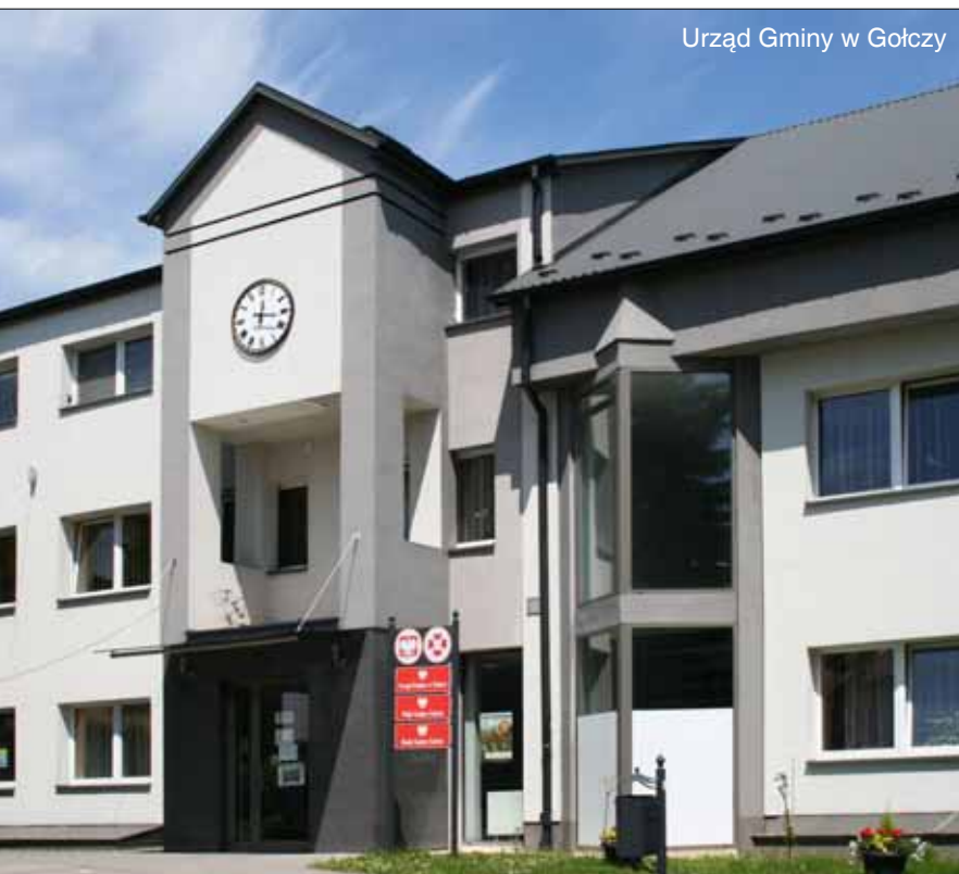
Urząd Gminy w Gołczy

Z ajmuje południowo-zachodnią część powiatu. Leży na pograniczu Jury Krakowsko-Częstochowskiej i Wyżyny Miechowskiej, a w części obejmuje Dłubniański Park Krajobrazowy. Szreniawa, Gołczanka i Dłubnia to trzy rzeki nawilżające obszar gminy. Najstarsze źródła pisane wspominają o Gołczy w 1325 r. Po II rozbiórce Polski Gołcza znajdowała się kolejno w zaborze austriackim, w tzw. Galicji Nowej, potem w Księstwie Warszawskim, a następnie pod zaborem rosyjskim. Po odzyskaniu niepodległości w 1918 r. i po II wojnie światowej gmina szybko odbudowywała się i rozwijała. Dzisiaj Gołcza stanowi centrum gminy. Wyróżniają ją: Biblioteka i Ośrodek Animacji Kultury, nowy ośrodek zdrowia i nowoczesna hala sportowa z kompleksem szkolnym.